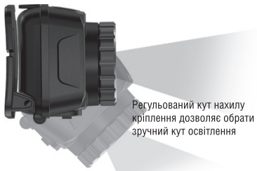
Регульований кут нахилу кріплення дозволяє обрати зручний кут освітлення