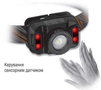
Керування сенсорним датчиком

Надійний ремінь зі зносостійкого матеріалу, м'якого за текстурою, з силіконовим кріпленням для ліхтаря, зручний у користуванні